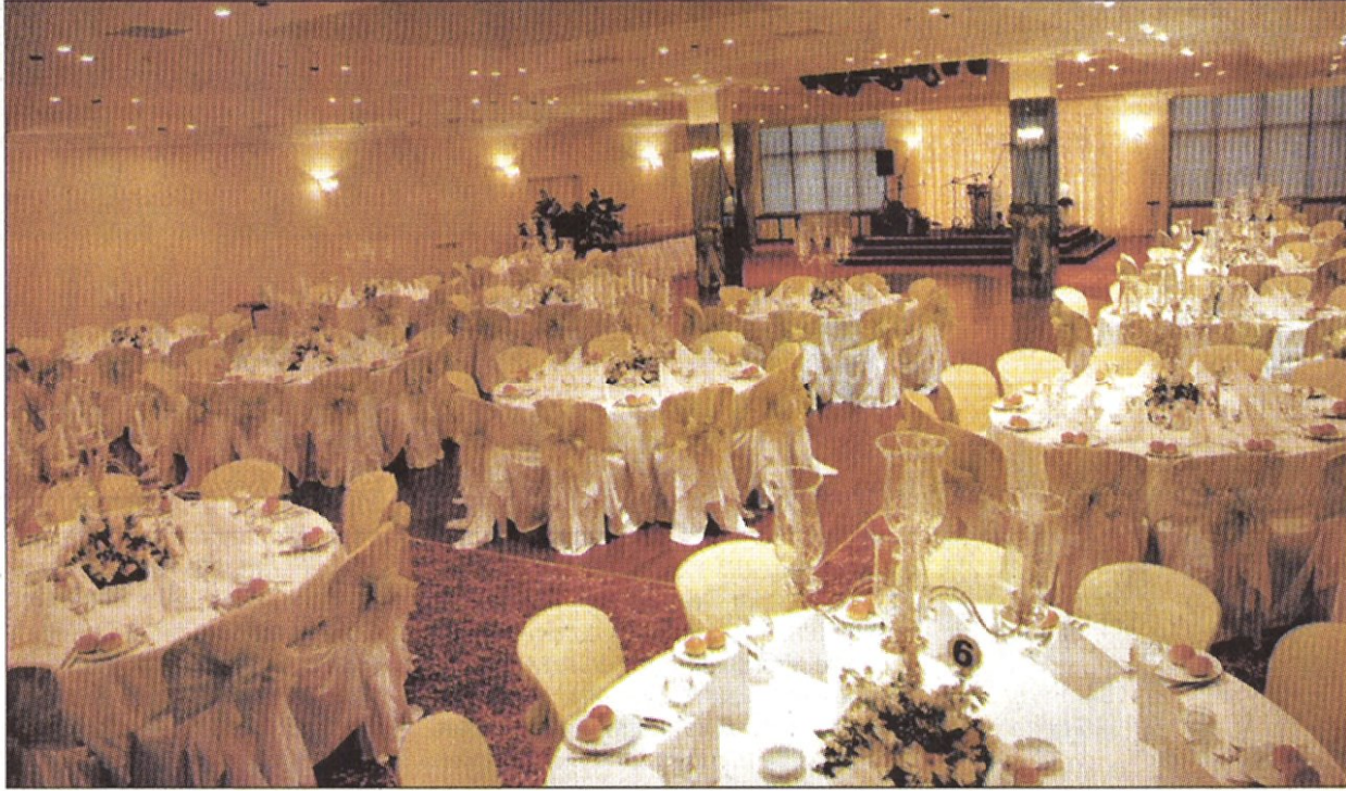
Kokteyl salonlarında artık 12 taksitle düğün yapma olanağı var...

1998 yılından bu yana ve Davet Catering Organizasyon tarafından işletilen, Kadıköy Belediyesi'nin bünyesinde bulunan Kokteyl Salonları, evlenecek çiftler için farklı ve özel organizasyonlara imza atıyor. Servis ve ikram hizmetlerinin Davet Catering tarafından sağlandığı salonlarda yılda ortalama 400 adet nikâh-düğün kokteyli ile 100 adet düğün yemeği gerçekleştiriliyor. Zengin ve farklı alternatiflerinin bulunduğu münü seçeneklerine isteğe göre alkol de ilave ediliyor. 100 kişiden 600 kişiye kadar hizmet verilebilen iki ayrı salonun en önemli özellikleri; tercihe göre nikâh-kokteyl veya nikâh-yemeği olması, saat