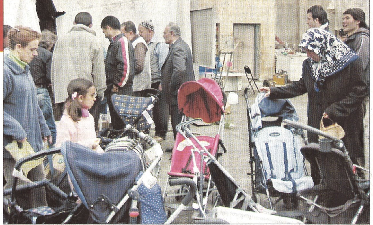
Satılan eşyalar arasında bebek arabaları da bulunuyor....