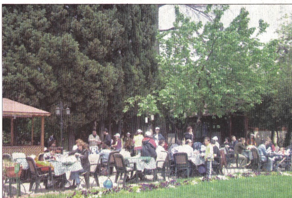
Doğa Huzurevi'nde kalanlar, geniş bahçesinde oturup sık sık sohbet ediyorlar...

Detaylı bilgi için: (0216) 345 42 62/414 99 16-17 www.kokteylsalonu.com